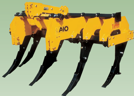
DATI TECNICI / TECHNICAL DATA / DONNÉES TECHNIQUES / TECHNISCHE DATEN / DATOS TECNICOS